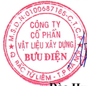
Đào Huy Trường